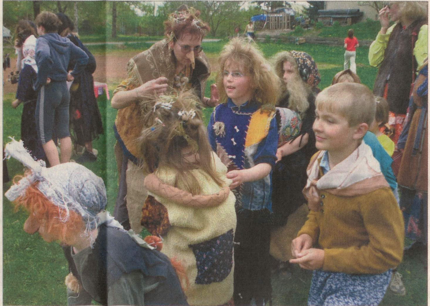
Pálení čarodejnic patří v obci mezi zvyky, na které se těší obzvláště ti nejmenší.

Jsou v podstatě pod veřejnou kontrolou, protože je venku každý vidí," usmál se staros-