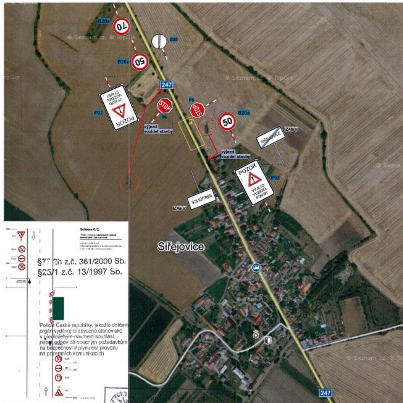
Příloha č. 2 k ODSH 97867/2021